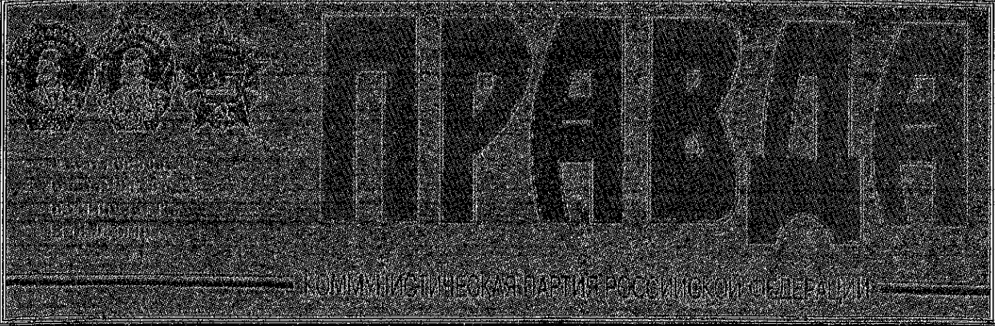
NOVEMBERMÁNAHAGANNAÐIÐ: ÞÓÐANOKUR ÚR ÞEÐIÞIÐIÐ

3. TÖLUBLAÐ 30. Nóv. 1999 MÁLGAGN STJÓRMÁLAFRÆÐINEMA GÓÐUR ÁRGANGUR